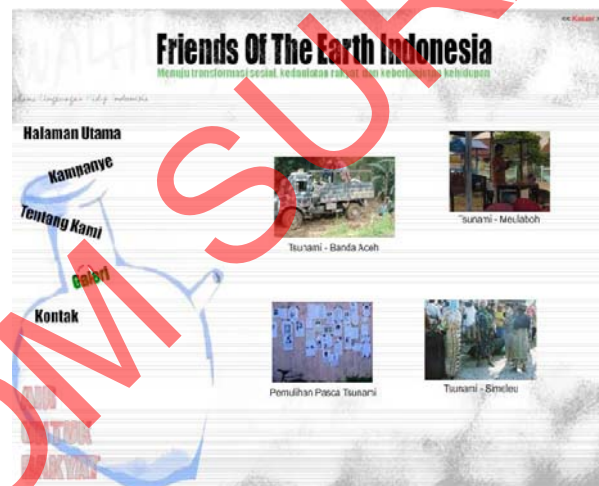
Gambar 5.5 Halaman Galeri