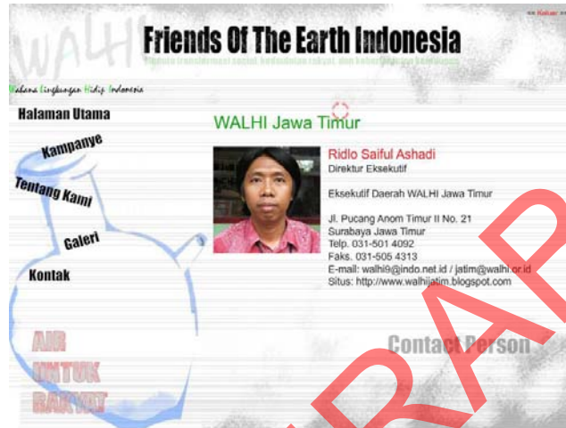
Gambar 5.8 Halaman Kontak