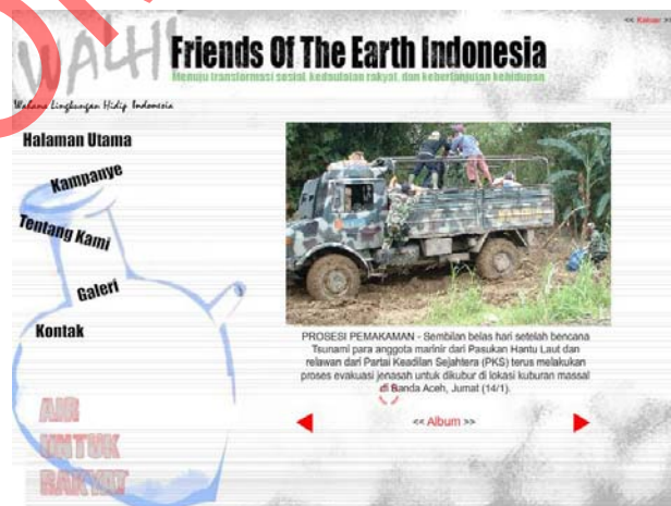
Gambar 5.7 Halaman Sub Galeri II