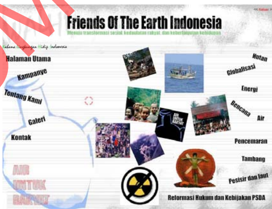
Gambar 5.2 Halaman Kampanye