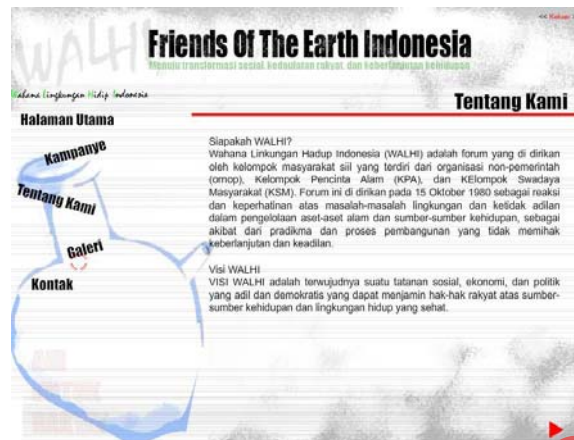
Gambar 5.4 Halaman Tentang Kami