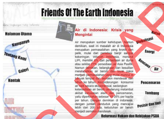
Gambar 5.3 Halaman Sub Kampanye

Halaman kampanye ini meliputi : Hutan, Globalisasi, Energi, Bencana, Air, Pencemaran, Tambang, Pesisir dan Laut, Reformasi Hutan dan Kebijakan SDA.