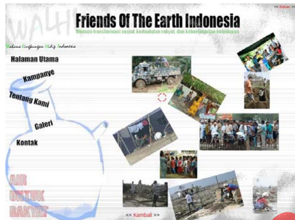
Gambar 5.6 Halaman Sub Galeri

Galeri WALHI berisi tentang masalah-masalah kemanusiaan, seperti : Stunami Banda Aceh, Stunami Neulaboh, Stunami Simeleu dan Pemulihan Pasca Stunami.